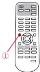
プロジェクター リモコン